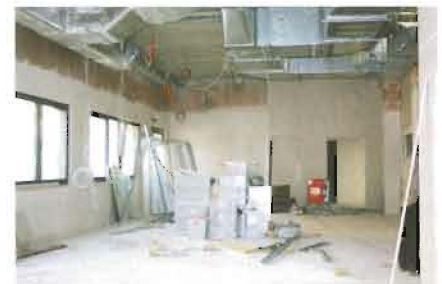
Derzeit noch Baustelle: Hier soll der neue Physiotherapieraum entstehen.